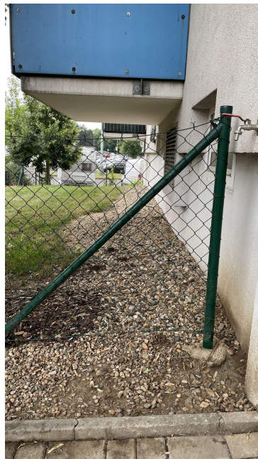
Obrázek č. 2 - stávající stav vpravo od vchodu