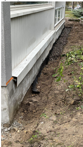
Obrázek č. 3 - ukázka požadovaného výkopu