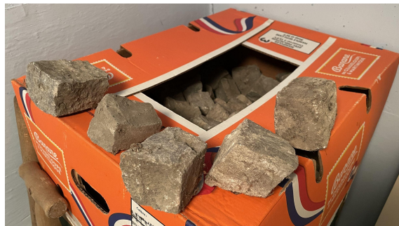
Obrázek č. 10 - ukázka dlažebních kostek