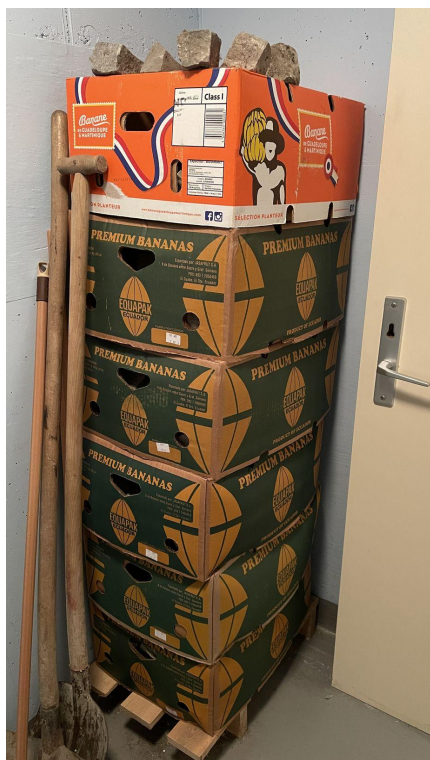
Obrázek č. 11 - množství dlažebních kostek