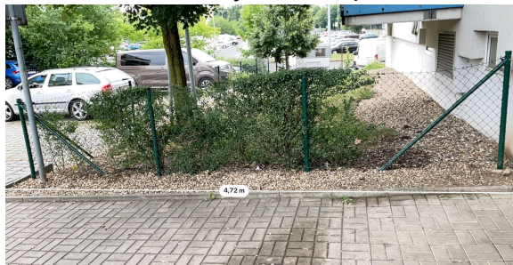
Obrázek č. 9 - stávající část u plotu