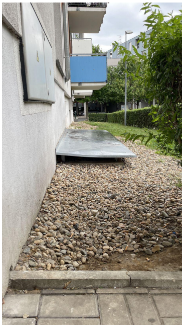
Obrázek č. 1 - stávající stav vlevo od vchodu