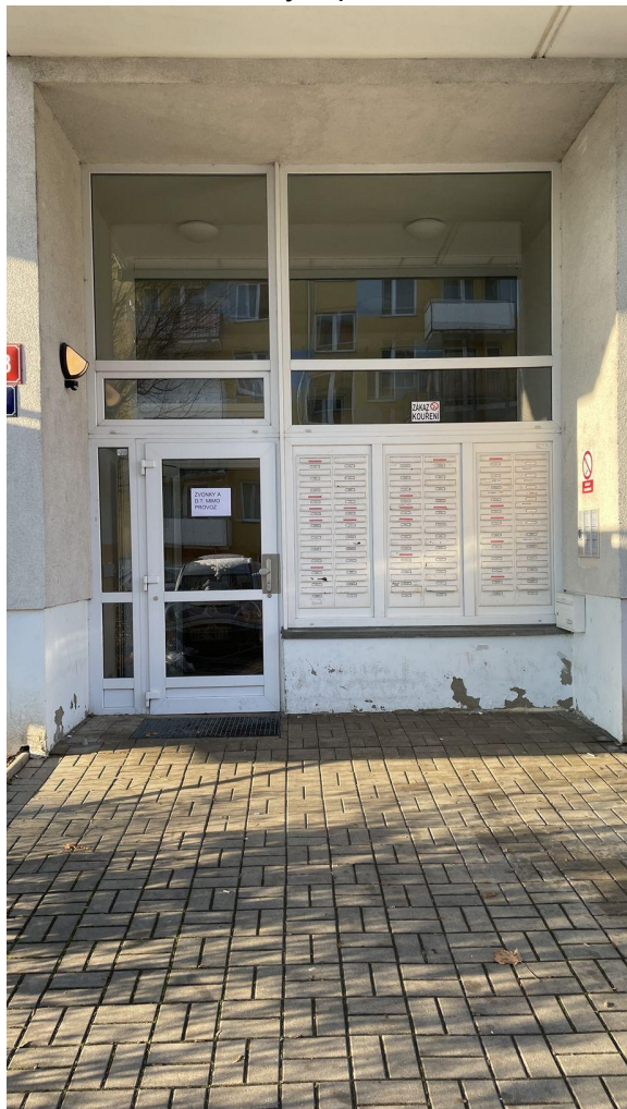
Obrázek č. 6 - stávající portál