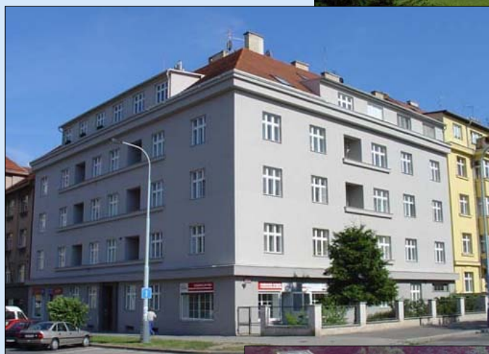
Činžovního dům Praha 6 – ul. Zelená