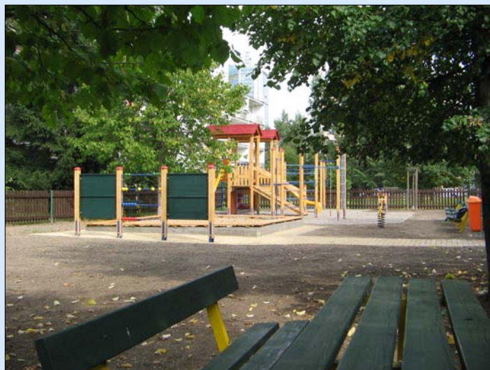
Dětské hřiště, Praha 4 ul. Kaplická