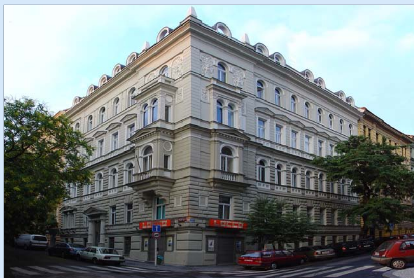
Činžovní dům, Praha 2 ul. Balbínova