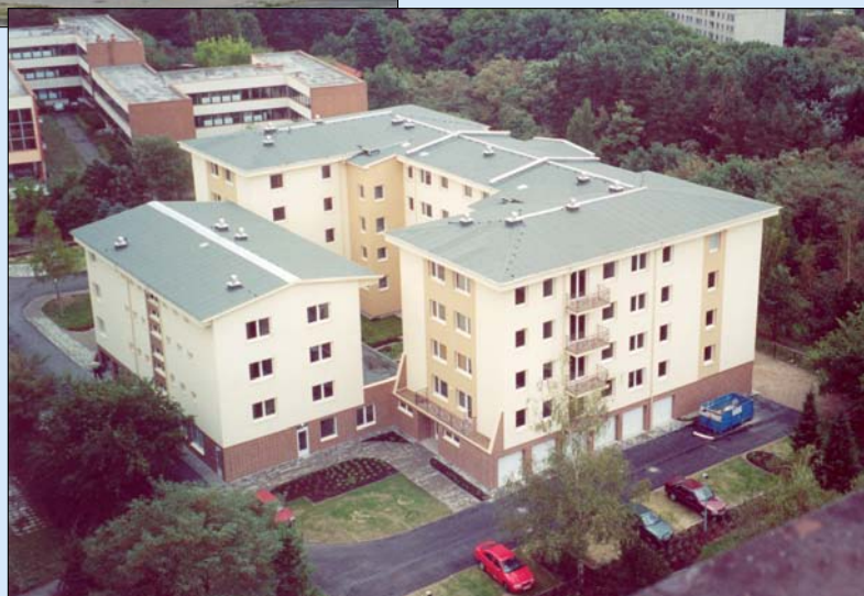
Polyfunkční objekt, Praha 4 Modřany - ul. Mráčkova